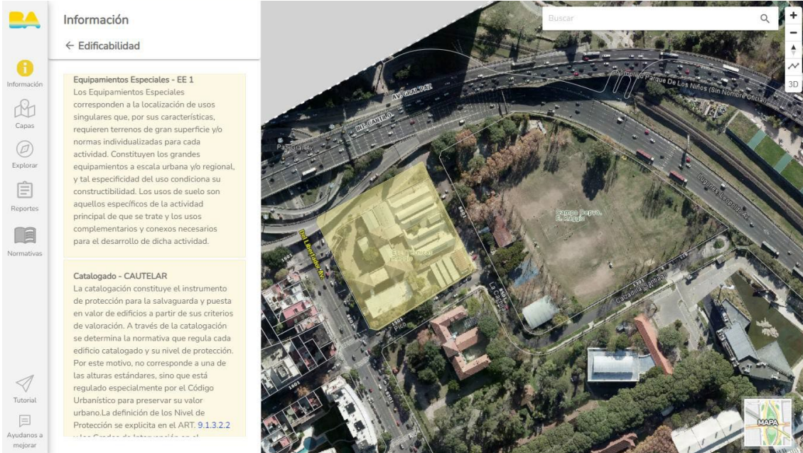
Equipamiento Especial EE1 - Escuela Raggio”

“2024 - Año del 30° Aniversario de la Autonomía de la Ciudad de Buenos Aires”